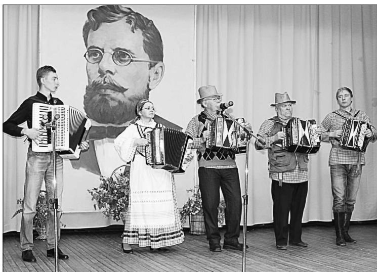
Выступление самодельных артистов.